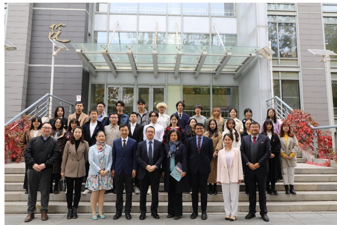
菲律宾驻华使馆电影展