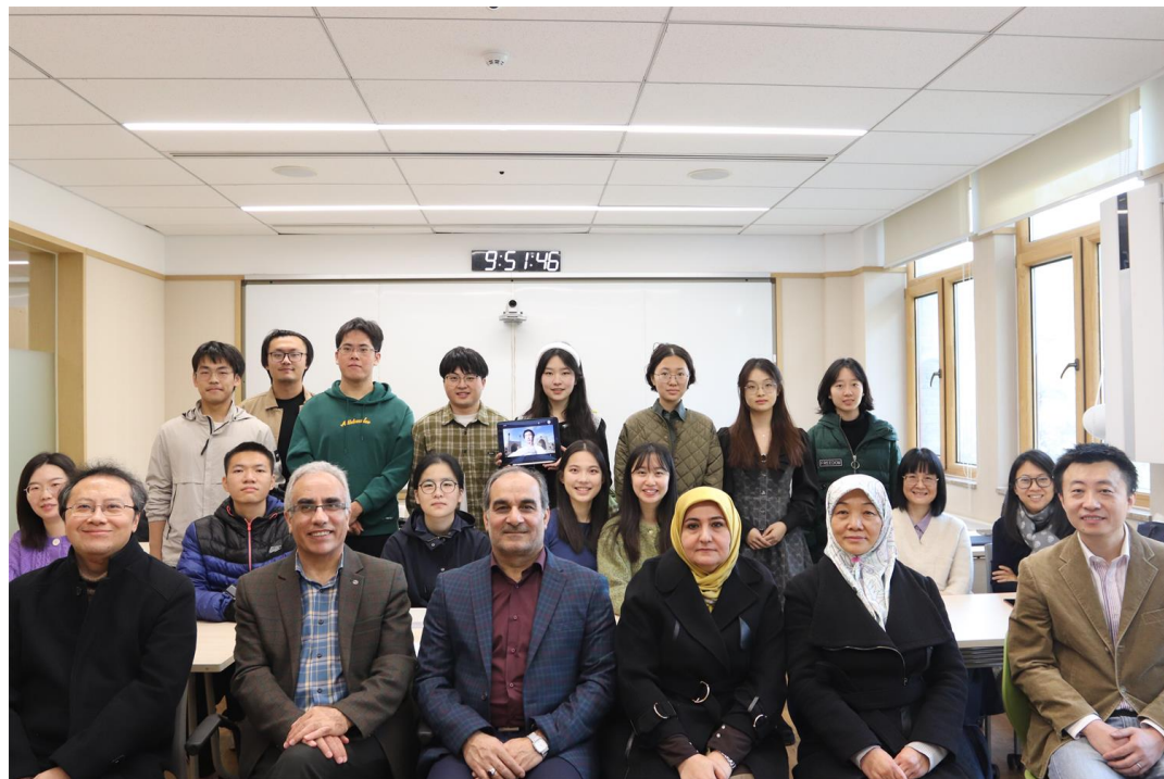
伊朗驻华文化参赞到访

School of Foreign Languages, Peking University